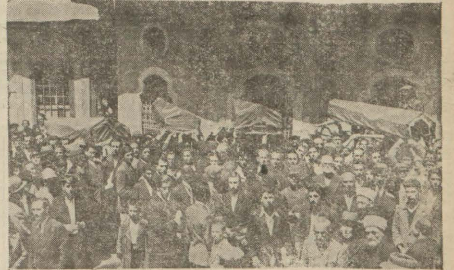
Cenaze merasiminden bir intiba

Merasimde kalabalık bir gençlik ve halk kütlesile bir deniz kıl'ası ve bir polis müfrezesi bulundu