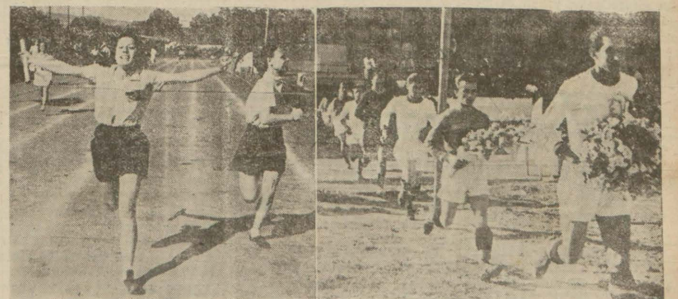
(Sağda) futbol takımları sahaya çıkarılarken, solda genç kızlar arasındaki yarışın neticesi

İstanbul Maarif müdürlüğü tarafından hazırlanan İstanbul kız ve erkek mekteplerinin spor bayramı dün Fenerbahçe stadında büyük bir kalabalık önünde cidden iftihar edilecek bir şekilde yapıldı. Kız ve erkek 908 sporunun iştirak ettiği bu spor bayramı çok parlak merasim ve büyük bir geçid resmi ile başladı. Mektepler arası spor hareketlerine geçen senelere nazaran pek büyük bir ehemmiyet verilmiş olduğu düşünülür. Müsabakaların heyecanı (Devamı 6 ncı sayfada)