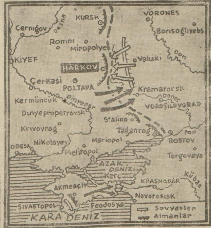
Harkofta harekât sahasını gösterir harita

Moskova 23 (A.A.) — Gece yarısı Sovyet tebliği: Cuma günü kuvvetlerimiz mevzilerini sağlamlaştırılmışlar ve Harkof istikametinde taarruz hareketi (Devamı 5 inci sayfada)